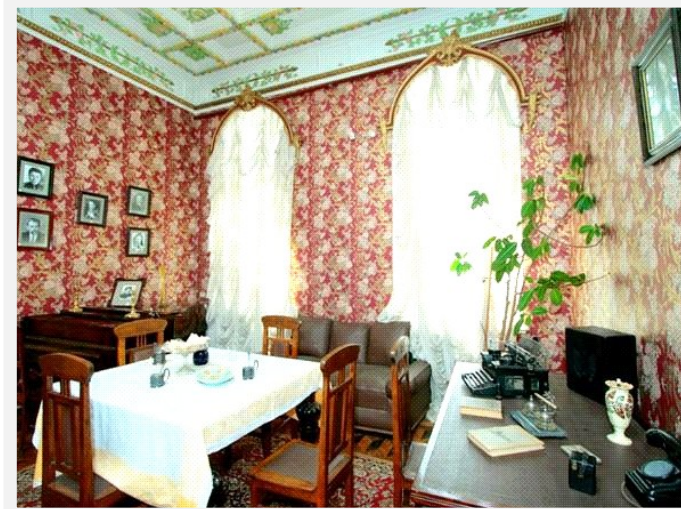
Шәриф Камалның музей-квартирасы

Адрес: Чакмагыш авылы, Кооператив урамы, 44 А Тел.: 3-13-46